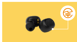
ワイヤレスイヤホン:本体やタグなど