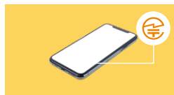
スマートフォン等では、液晶画面に表示される場合も