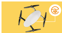
ドローン:送信機とドローン本体の裏側、側面または内蔵バッテリーを取り外した部分など

無線機器の見やすい箇所や、 取扱説明書および包装または容器、 ディスプレイ等に表示されています