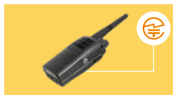
トランシーバー:裏面または内蔵バッテリーを取り外した部分