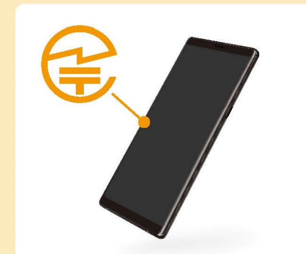
スマートフォン等では、液晶画面に表示される場合もあります