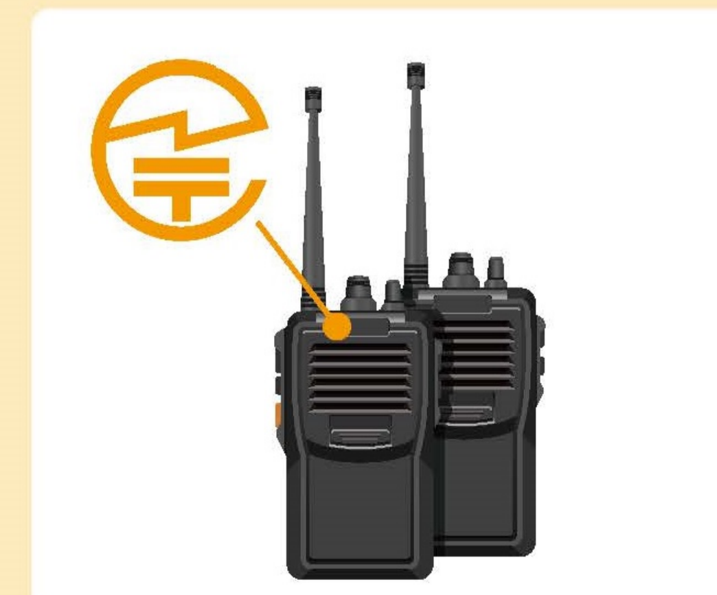
トランシーバー：裏面または内蔵バッテリーを取り外した部分