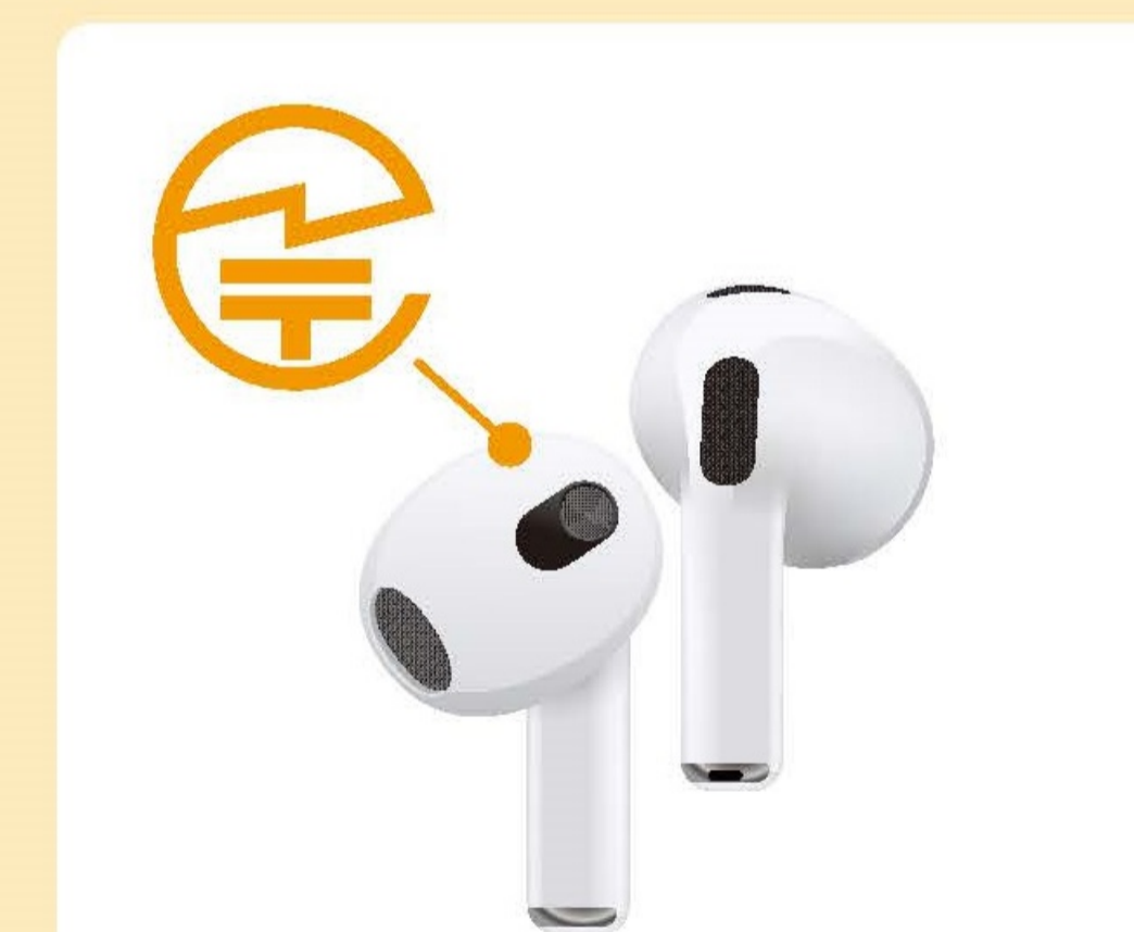
ワイヤレスイヤホン：本体やタグなど