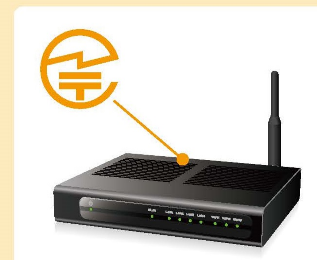
無線LAN 据え置き型の機器：裏面

多くの場合、無線機器の型式名称や製造者が記載された銘板や外箱に表示されています。