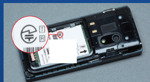
携帯電話やPHS：内蔵バッテリーを取り外した部分