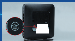
無線LAN 据え置き型の機器：底面