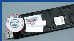
無線LAN USBタイプの機器：背面